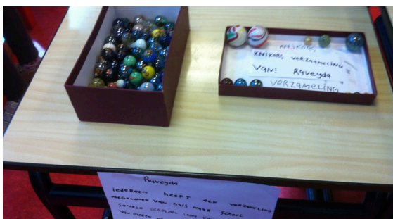
Kinderen uit de andere klassen komen de verzamelingen bekijken.