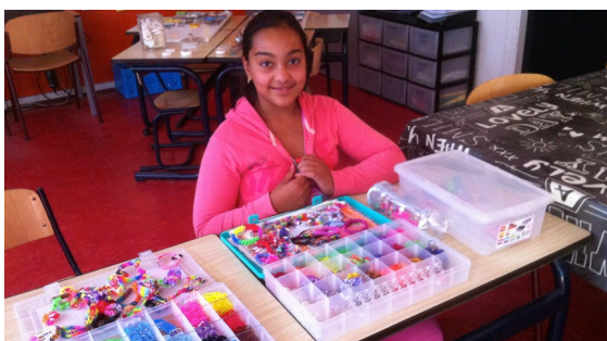
Verzamelingen van de kinderen horend bij het thema: 'sport en hobby's'