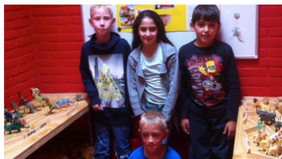
Samen spelen, leren en delen.